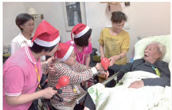
▲95歲的倪奶奶為102歲的萬爺爺報佳音。