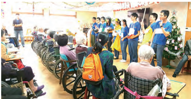
▲嘉義大學志工同學表演聖誕戲劇

【嘉義訊】聖誕節的真光真愛，為人們帶來希望和溫暖，而每年的聖誕節時分，聖馬爾定醫院附設護理之家也都和國立嘉義大學農藝志工服務隊合作舉辦慶生會活動，為7月~12月的壽星長輩慶生，去年聖誕節也讓長輩在聖誕節的溫馨氛圍下享受熱鬧的慶生會。