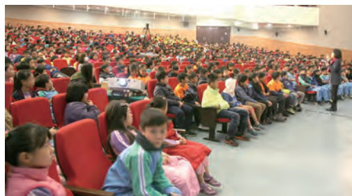
▲埔墘國小800位師生參與音樂會彩排。