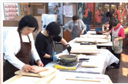
▲畢業班學員們認真準備畫板

我相信聖像畫不但能安慰寫聖像的畫員，更能在聖像畫所到之處，安慰天主的子民！作為初學生，我才能細細品味學校課程的精隨。回台之前，向同學及學姊分享了，想在台灣辦「聖像畫培育班」的夢想，順便向她們中的幾位，募集需要費時2年才能完成的一整套習作畫板。她們一聽