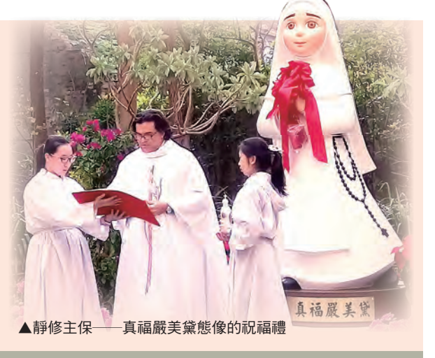
▲靜修主保——真福嚴美黛態像的祝聖禮

真福嚴美黛是義大利貴族之女，10歲自願入修院，親見修女們可以領聖體，非常羨慕。1333年9月16日的耶穌升天節，修女們上前領聖體，唯獨她跪在原地，聖體忽然從聖杯中飛到了她的舌頭上，這是天主特准的奇蹟。敬領後，在跪凳上靜默祈禱，竟是帶著笑容、安詳地離開人世，得年10歲。教宗為紀念她純潔的德行，訂每年5月13日為她的紀念日。