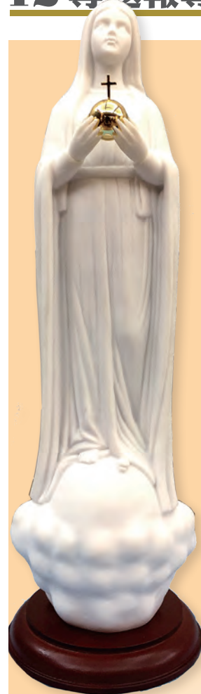
▲拱球聖母像紀念品，含底座高30公分，聖像後側底部盒中可放置祈禱意象。