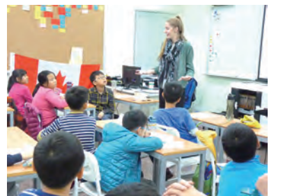
▲ESL教學系統，開口說英文不是難事。