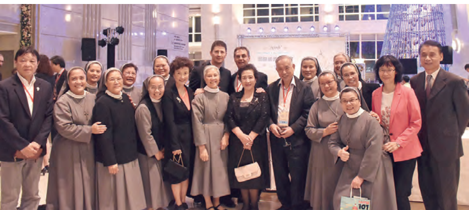
▲教會神長和主內肢體通力合作，為聖瑪爾大女修會的光臨精神與愛德服務在台北101作見證。

高德隆代辦特別邀請克羅埃西亞的人聲聖樂團(A Cappella) Klapa Mriza在音樂會獻唱多首義、法歐洲語系的知名清唱聖樂，空靈清徹的多部和聲優美樂音，迴盪於台北101信義大廳，使人深深沈醉於靜謐平安的夜晚中，因為有愛，一切是如此美好。加上聖瑪爾大女修會修女們的真摯歌詠，天主子民譜下了最美好的合聲時刻，祈願在主愛中，世界和平喜樂。