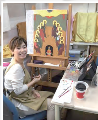
▲畢業班學員歡喜準備畢業展作品

在聖誕期中，這份感觸更深……。生命就是如此一份大禮，天主每天繼續不斷地「堆疊」祂對我們的深情厚愛。在祂內，雖然每走一步，都是那麼地無法預測；但美善的天主，「使