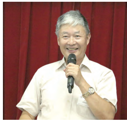
▲主僕疏效平主領風中傳愛講習會 ◀因主名而歡聚

肉性的把握不在了，消褪了，肉性很有把握，就抵擋聖神，「我不需要天主」。不願意順服的時候，主的手、主的神會幫助我們，這是祂的愛，使得我們成全。我們願意背十字架的時候，在聖神的引導中，對信的人祂的話是磐石，對不信的人是絆腳石，誰都過不去，祂的話不改變。伯多祿講的三次「我愛祢」就不是搖搖擺擺的，自己的生命也肯定了：「我愛祢是真的。」