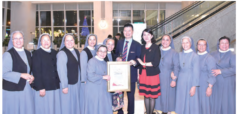
▲承蒙台北101公司及大樓租戶的慷慨義助，聖瑪爾大女修會的修女們特地向台北101周德宇董事長致謝，並與周董事長夫婦合影。