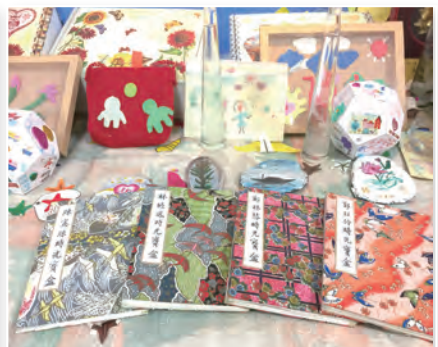
▲生命故事書記憶老人家一生值得回味的美食