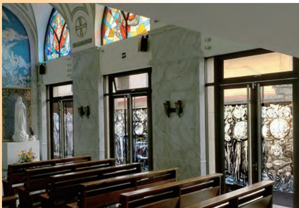
▲6幅《創世紀》雷射雕刻圖案

1699年(康熙38年)第一批遣使會士畢天祥及穆天尺神父踏上了中國土地。1783年教廷傳信部正式命令遣使會接替耶穌會在中國的一切傳教事業，迄1949年政府遷台，遣使會在中國服務共計26個教區，教友人數成長了4-5倍之多。溯自1966年起，在中國的遣使會士及修士約計1200位，來自中國以外世界各處21個國家，並有65位主教。去年4月甫落成的濟世樓，其名命即為紀念1947年擔任江西南昌教區遣使會士周濟世總主教 (Archbishop Joseph Chow)，他與北平教區田耕莘總主教、南京教區于斌總主教為當時全中國3位華人總主教，1949年後他是留在中國大陸品級最高的