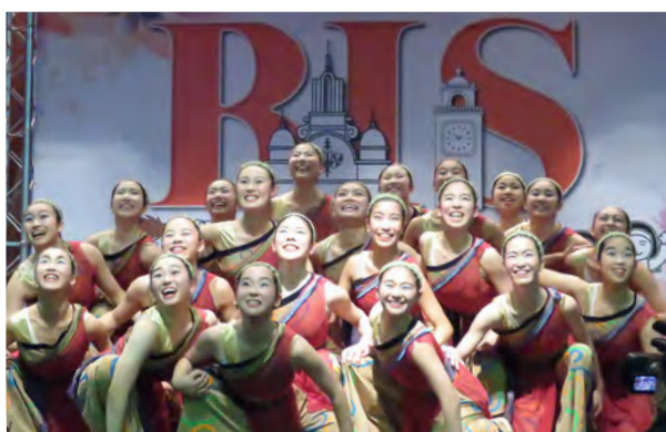
▲百年校慶歡慶會上，日本光之丘姊妹校舞蹈表演。