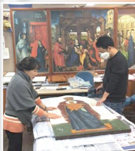
▲會員奉獻時間修復聖像畫

一切協助那些愛祂的人，就是那些按祂的旨意蒙召的人，獲得益處。」(羅8:28)耶穌來到人間，又返回天上，這一切是為了把對天鄉的渴望，明確地烙印在我們的心中。聖像畫員蒙召為教會服務、把天上的聖容，藉著聖像畫散播在人間，好似浩瀚的宇宙間，到處一閃一閃的小星星。教人們憶起身心靈終究所要歸向的那片土地！在渴望中前行……。