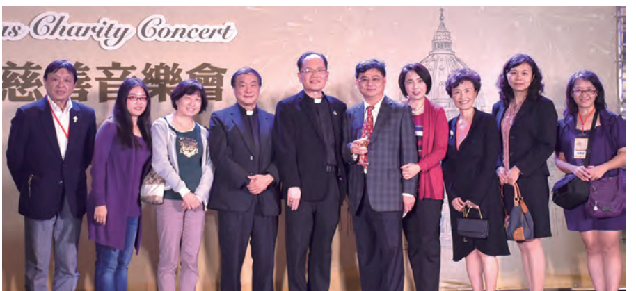
▲包括台中、新竹等教區的神長和教友們專程北上，支持教會與台北101合辦的聖誕慈善音樂會。