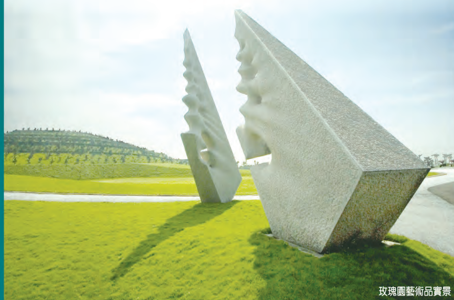
玫瑰園藝術品實景