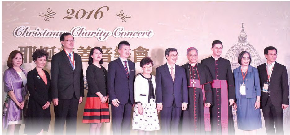
▲天主教會與台北101合作舉辦2016年聖誕慈善音樂會，陳建仁副總統伉儷、台北101公司及大樓租戶、教廷駐華大使館、主教團、博愛基金會及外交部的貴賓，與會支持聖瑪爾大女修會在後山偏鄉的愛德服務。