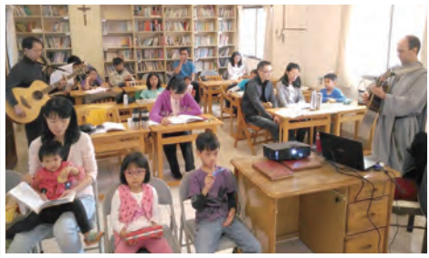
▲特別為小朋友開的課程

這一次的家庭避靜也安排了親子課程，讓小朋友可以一起參加，呂神父給小朋友們講了撒種的比喻（參路8:5）