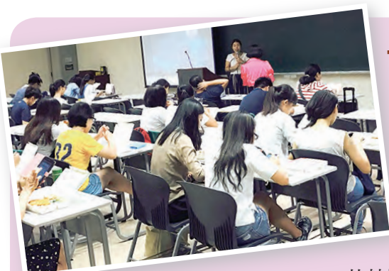
▲特殊教育電影——海洋天堂

次見面，但卻深深感受到我們就像是一家人的感動。 這一次的家庭避靜活動，每天與神父們默禱、晨禱、日禱、晚禱，讓我印象十分深刻，神父們帶領我們吟唱《聖詠》，在吟唱過程中，感受到如同天國中眾天使與長老們齊聲讚頌上主的情景。感謝主，帶領我們參加這個特別的家庭親子避靜，準備好我們的心迎接小耶穌來臨，也感謝若望使徒兄弟會的小灰神父們！