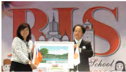
▲靜修女中與日本北海道札幌靜修女中締結姊妹校之約，雙方交換禮物。 ▶靜修女中行政團隊踩街特別用策畫的遊行裝扮：不愁者聯盟

嘉年華活動吸引上千名師生、家長、校友及社區民眾參與。國中、高中部共29個班參賽，個個卯足全力競拚，創意十足；為鼓勵學生的熱力演出，學校把募得各界捐款高達8萬元的禮券來獎勵踩街優勝班級，展現師生熱情、活力及創造力，有效聯結學校與在地文化。百年校慶活動讓每位師生、校友及家長都留下美好回憶，同心感謝天主的滿滿恩寵與賜福。