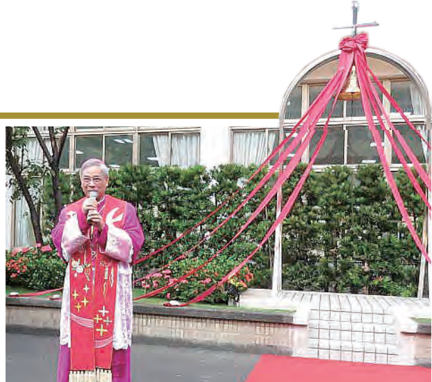
▲百年鐘塔祝福禮，洪總主教期勉深深。

陳建仁副總統伉儷在2016年12月24日上午出席靜修女中百年校慶，祝福靜修女中生日快樂，再創另一個百年風華；期勉學子們培養具有前瞻視野與創新能力，成為感恩惜福、負責服務、與人共融合作，並能立足台灣、放眼世界的卓越公民。