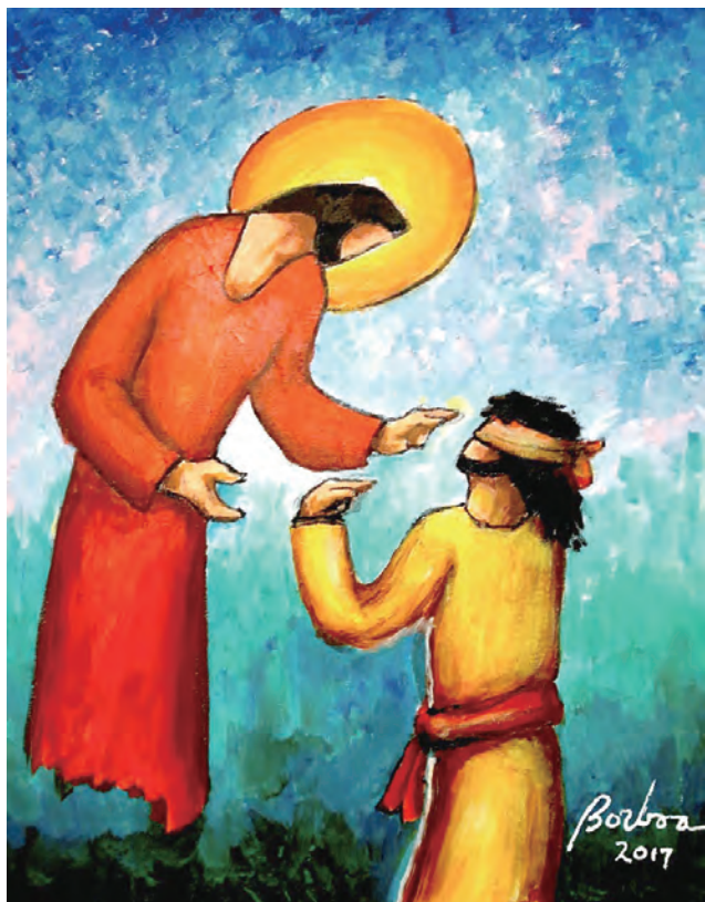
▲主，請打開我們的眼睛，讓我們看出祢化身為不同的人，時時刻刻帶給我們祢的愛，祢的陪伴和祢無微不至的降福。（畫家鮑博的新年祝福）

有人說，台灣最美的風景是——人！這句話，早些年我還無法真正感受，然而，在《天主教週報》的編輯檯上坐了8年之後，親眼看到天主教會中有許多沒沒無聞的人，一生默默行愛，奉獻生命中最精華的歲月，從青春到中壯年，做著簡單而微小的事，平凡而永遠無法得到回報的事，他們為最需要援助的人打造幸福與希望，在經濟掛帥，精算投資報酬率的現代社會，這群人無疑是個「傻子」，然而，主辦單位光啟社深深感念於許許多多神職人員、修士、修女與教友們默默地在各領域義務服務，不求回報，他們用大愛做善事，遠超過工作所需或是世俗期待，無私無我、無怨無悔地持續行善超過10年，20年，半世紀，甚至一甲子，他們的思言行為真的太值得表彰，也以「無我服務獎30」表達我們的感激之情，更重要的是，藉著「無我服務獎30」的好榜樣，讓現代年輕人有個學習效法的對象。