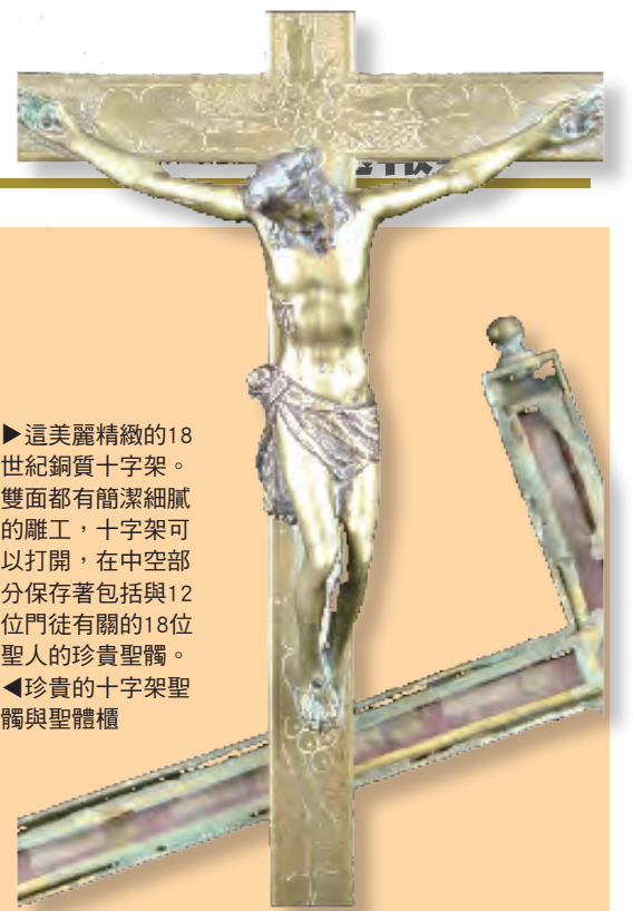
▶這美麗精緻的18世紀銅質十字架，雙面都有簡潔細膩的雕工，十字架可以打開，在中空部分保存著包括與12位門徒有關的18位聖人的珍貴聖髒。 ◀珍貴的十字架聖髒與聖體櫃