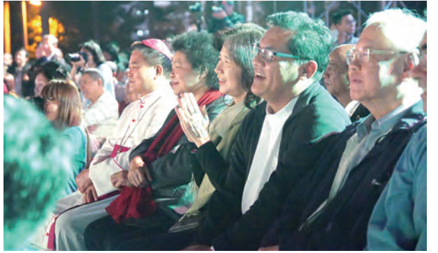
▲高雄教區2016年12月25日聖誕節當晚，在高雄市中央公園草坪演出真人馬槽《聖誕史實劇》，高雄市陳菊市長、府會官員及民眾都熱情參與；演出前，劉振忠總主教率領教友，或騎馬或徒步，沿途報佳音。