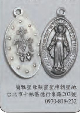
蘭雅聖母顯靈聖牌朝聖地 台北市士林區德行東路202號 0970-818-232

聖母顯靈聖牌正面是天主無玷之母瑪利亞站在球體上，球體代表世界，腳踏一條被她踩碎的蛇。從聖母伸開的雙手所射出的光線，象徵豐盛的聖寵，將賜給所有向她求恩者。圍繞著聖像的字句是：「吁！瑪利亞，無染原罪之始胎，我等奔禱台前，為我等祈！」聖牌反面下方有兩顆聖心，被刺冠圍繞的耶穌聖心和被利劍穿透的瑪利亞聖心。其上是一個大寫字母M，上面是一橫條與十字架，代表耶穌與瑪利亞兩顆受苦的聖心，為了我們的得救而結合在一起。圍繞的十二顆星則代表十二位宗徒。