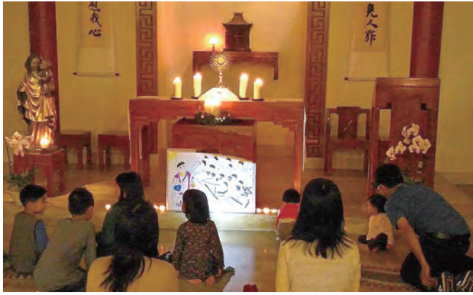
▲美好動人的明供聖體