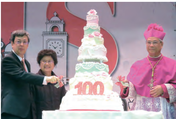
▲陳建仁副總統伉儷與洪山川總主教，共同切下7層大蛋糕。