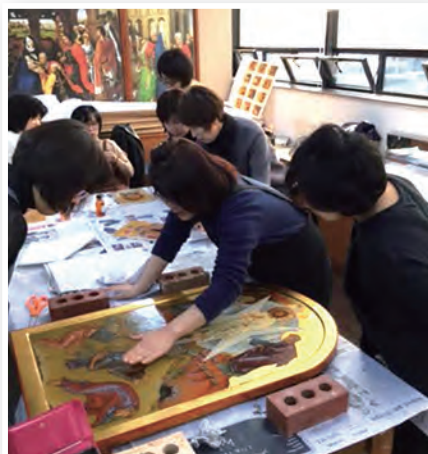
▲聖像畫助教指導油封(Olifa)步驟

聖像畫員並非是透過創作表達自我的人，而是一群以寫聖像畫服務教會的「工人」。聖像畫之所以經過時間的千錘百鍊，還能以相同的面貌(即風格)凝視世人，正是因為聖像畫是靈性的存有，聖人聖女、耶穌、聖母和天使們在畫中活著！為了能持守聖像畫的靈性，最好在素描階段就接受培育，幫助學生能逐漸掌握那能表達出