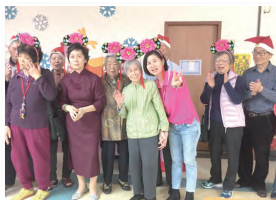
▲戴著格格帽的奶奶們，個個笑逐顏開。

人生四季各有風景，安在當季，感恩天命！秋冬雖不及春夏的嬌嫩與熱情，卻有著獨特的豐盛與豁達。在安養區一樓中廳，展示著「時光寶盒的故事」專區，陳列著長輩們美好回憶的暫存檔，每個珠寶盒內存放著一位長輩獨特的生命故事和物件，這是由傳承藝術團體在中心陪伴長輩的豐碩成果展示，透過藝術創作來陪伴長輩，重整生命、發掘潛能。在厚厚的生命故事書中，傳承藝術志工們以娟秀字跡搭配美麗圖案，逐頁記載著：我是誰、生命中最重要的人、現在想起心情仍會激動的事、最重要的東西、最遺憾的事、未完成的夢想、以及如果那一天到來，想要向誰道愛、道歉、道謝、道別。翻閱這幾本由專業團隊為長輩們製作的生命故事書，當下不禁也逕自問起這些問題的答案。